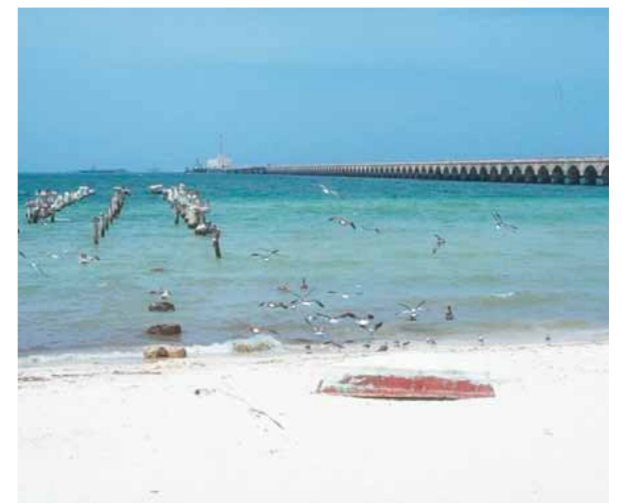
Piren till höger är armerad med rostfritt och står kvar efter många år i aggressiv miljö med vatten, värme och salt. Piren till vänster fick ett betydligt kortare liv på grund av materialval.