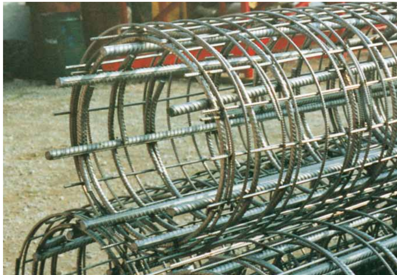
Svetsade pelarkorgar i rostfritt används med fördel där konstruktionen utsätts för t ex vägsalt, stora temperaturvariationer och mekanisk nötning.